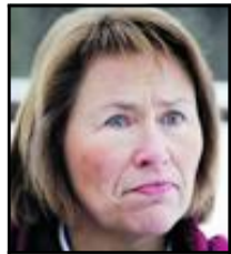
Grete Faremo, forsvarsminister om at kongen ikke fikk dele ut krigskorset.

Det er ikke vanskelig å skjønne at dette er spørsmål det knyttes sterke følelser til.