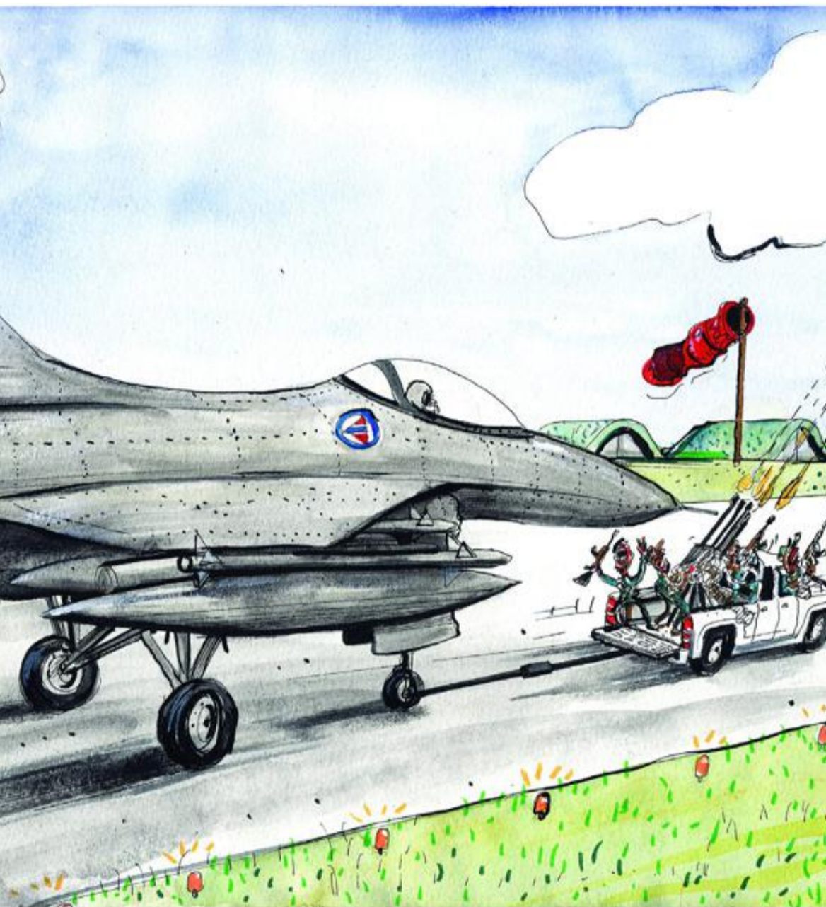
Gaddafis soldater og ødelegger hans infrastruktur, men utøver egentlig blind vold, skriver artikkelforfatteren.