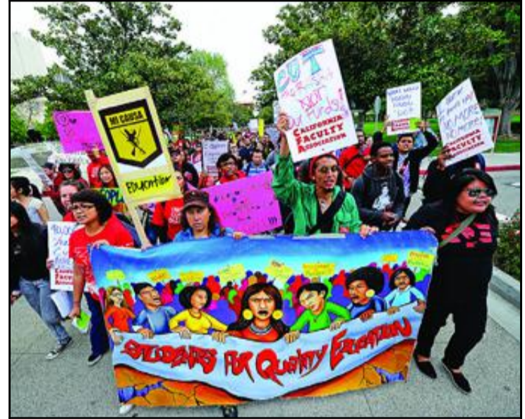
DEMONSTRERER: Studenter ved University og California demonstrerer mot budsjettkutt tidligere i år.

De stemmer som nå kritiserer Advokatforeningen, forstår ikke hvor viktig det er ha et bevisst forhold til sin egen rolle, ikke